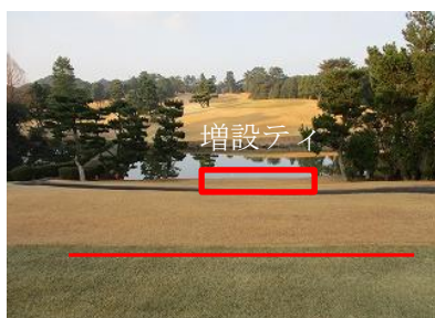
現在のティーグラウンド