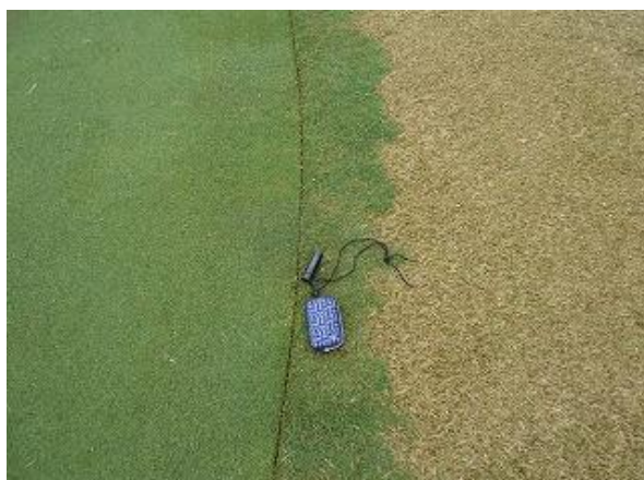
はみ出しベント処理状況(30年2月)