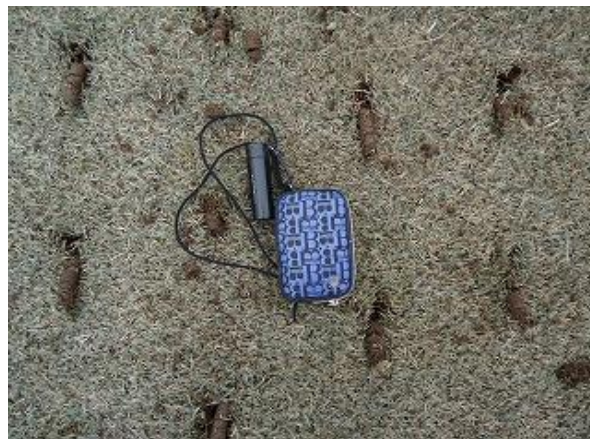
FW・RW(平面RW)コアリング状況(30年2月)