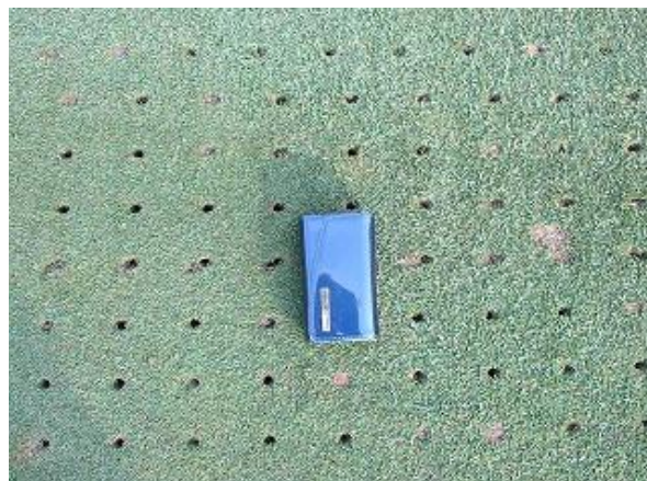
グリーン コアリング実施状況(30年3・6・9月)(6mm～8mmタイン・深さ10cm～)