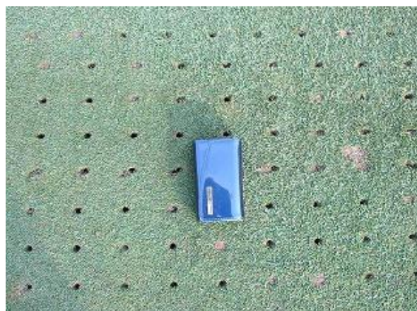
グリーン コアリング実施状況(30年3・6・9月)(6mm～8mmタイン・深さ10cm～)