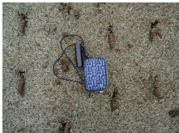
FW・RW(平面RW)コアリング状況(30年2月)